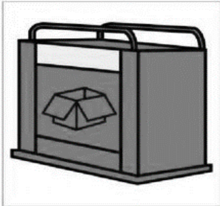
Cartón, papel y diario

d. Pídale a su hijo(a) que observe las siguientes imágenes, seguidamente invítelo a reciclar la basura, luego con un lápiz grafito que una con una línea con el contenedor correspondiente.