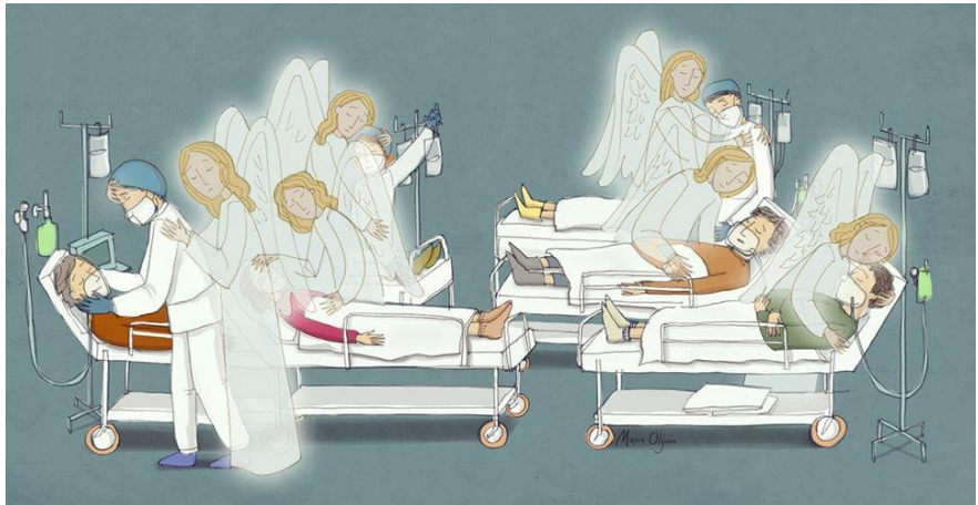
“En momentos de dificultad el Señor está con nosotros”